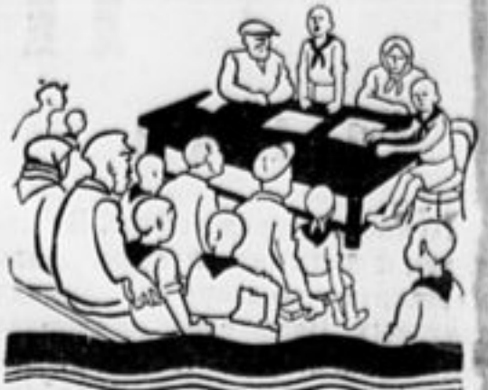
В г. Томашполе родители о большим интересом слушают доклад о работе отряда. Д в о с.