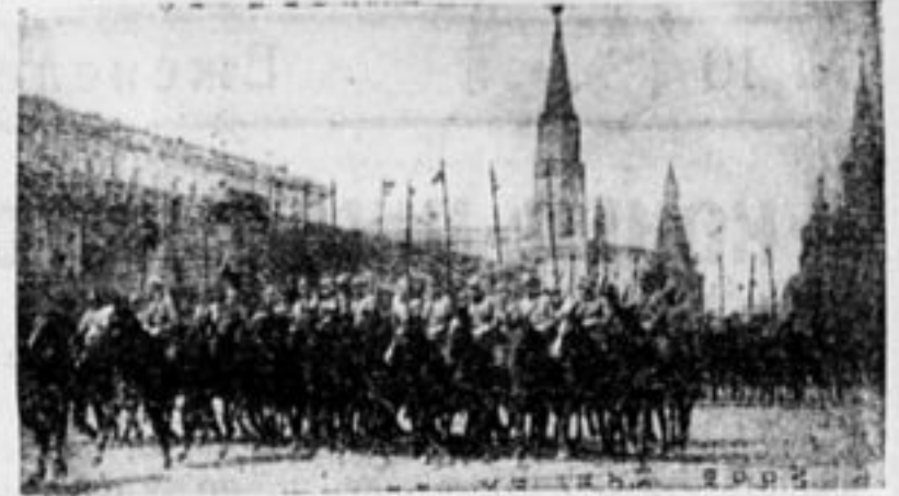
Красная кавалерия 1 мая.

На автомобилях и трамваях весь день катались октябрята и дошкольники.