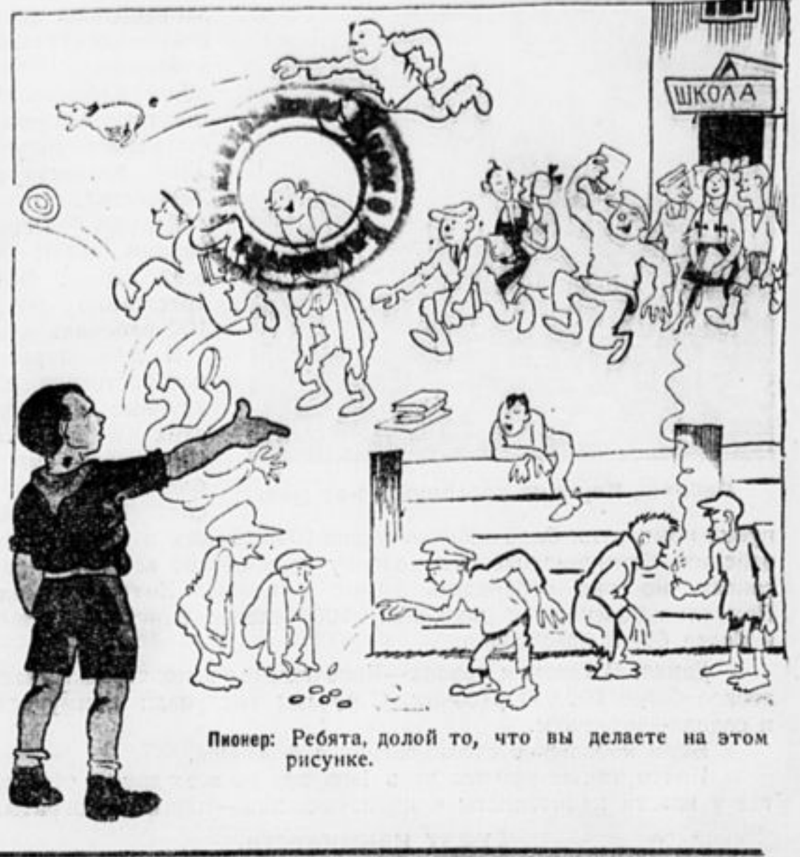
Пионер: Ребята, долой то, что вы делаете на этом рисунке.

На текстильных фабриках рабочие работают всей семьей: муж, жена, дети. Работают по тридцати часов непрерывно, и зарабатывают в неделю около двух рублей. Чтобы дети не кричали от голода, матери дают им опиум.