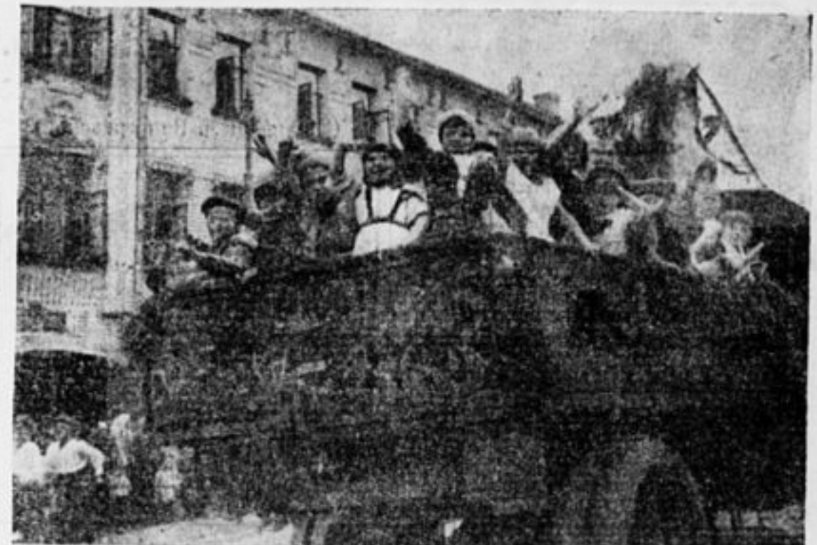
1-го мая мы весь день катались на автомобиле.

ся на 24 части и наверху их пишутся часы, 1,2,3, и т. д. до 24. Наверху хроно-карты пишется число, месяц и год, отряд, звено и фамилия. Записывать в хроно-карт. нужно так: например: спал от 10 до 8 час. значит нужно зачеркнуть от 1 час. до 8 и от 22 до 24, а где пишется что делал, написать-сон. Л. Подвойский.