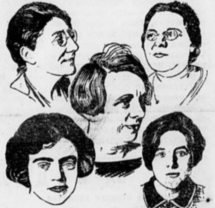
Члены английской делегации.