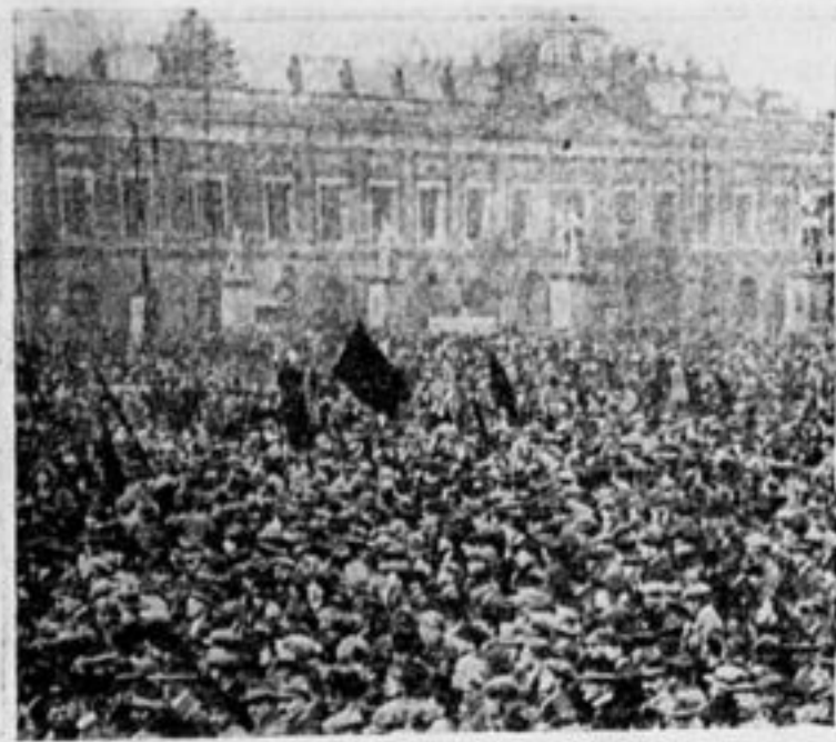
Рабочие Берлина празднуют 1-ое мая.

За это выступление было арестовано более 200 рабочих. Германия. Меншевики призвали рабочих не устраивать демонстраций, а собираться только в закрытых помещениях. Несмотря на это, около 150 тыс. рабочих Берлина вышли на демонстрацию под знаменами коммунистов. С речами выступали только члены компартии.